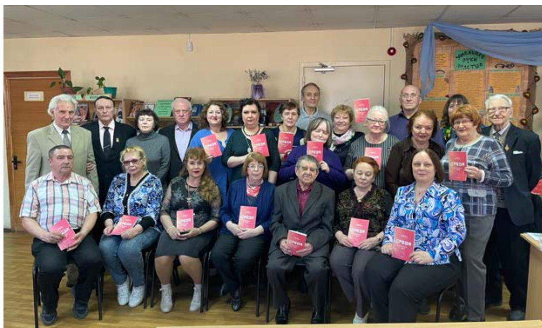
Литературное объединение «Среда поэта»