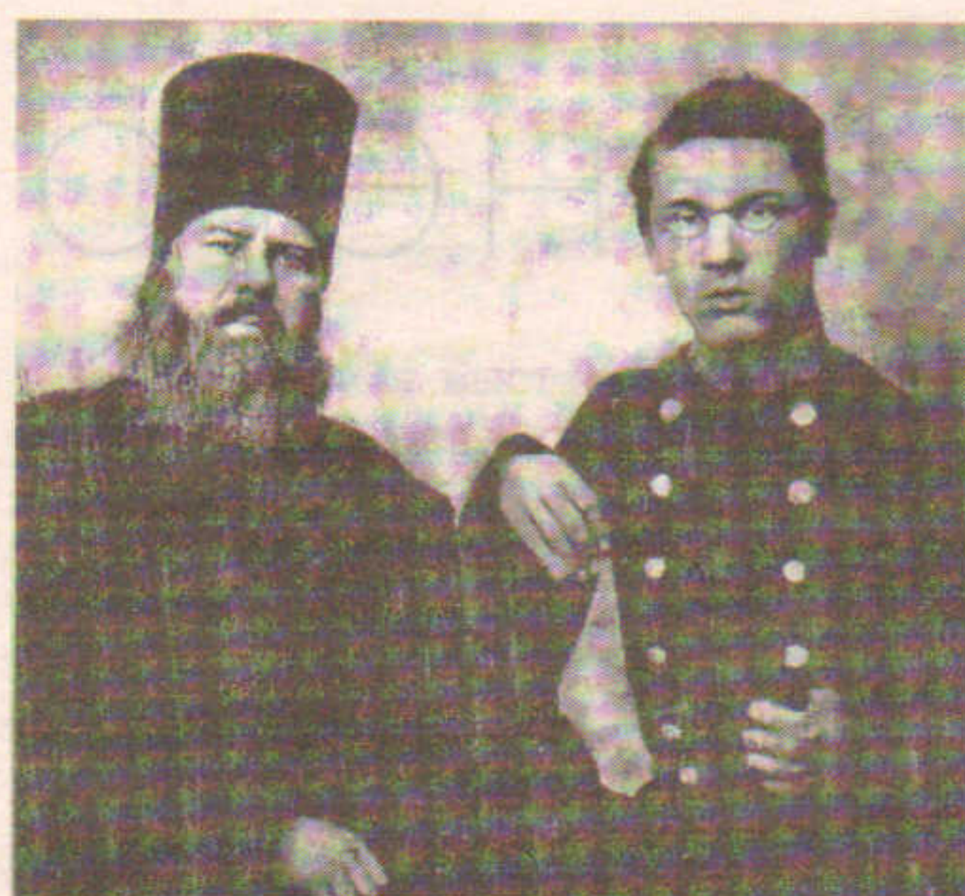
Николай Добролюбов с отцом. 1854 г.