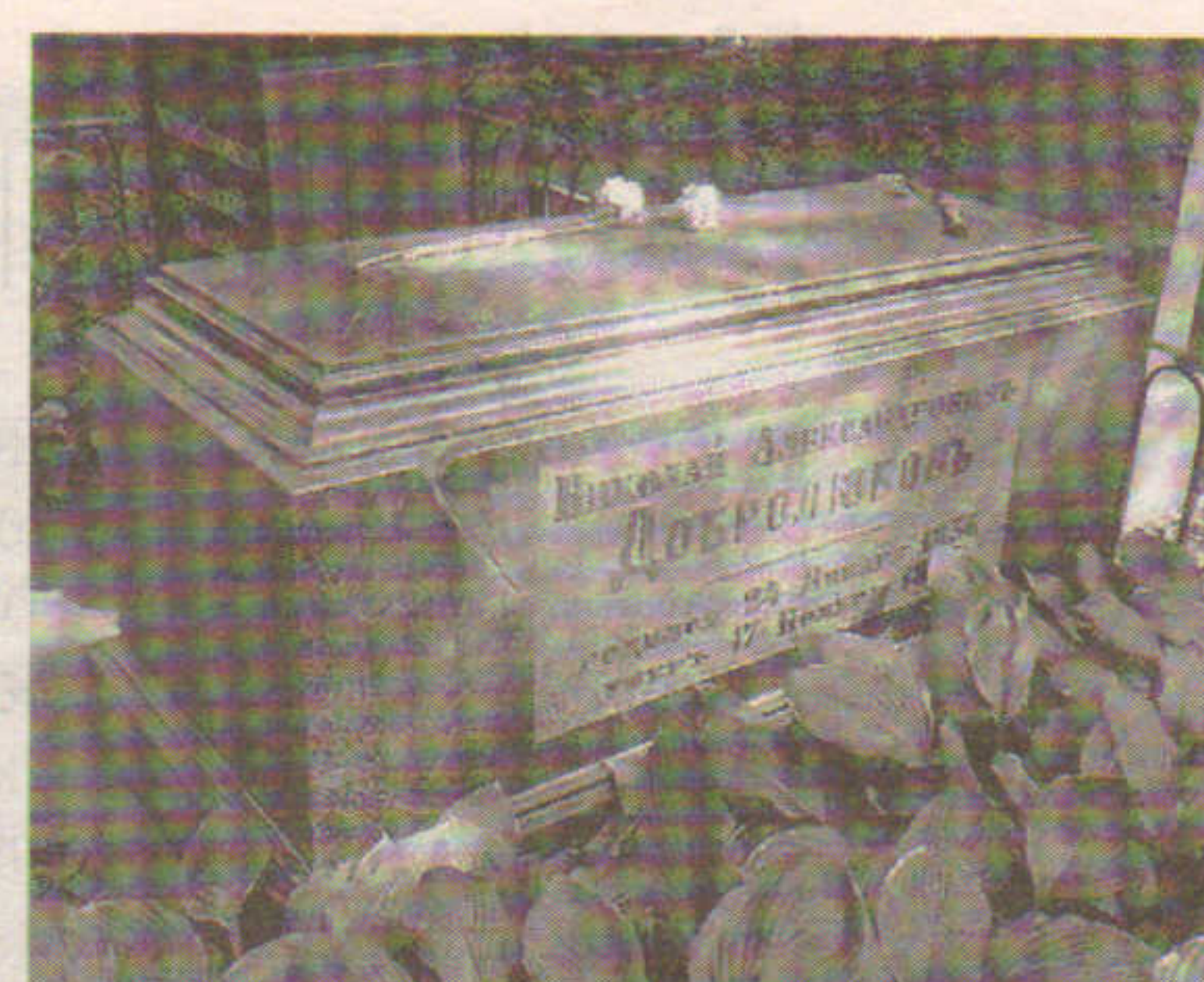
Могила Добролюбова на Волковском кладбище