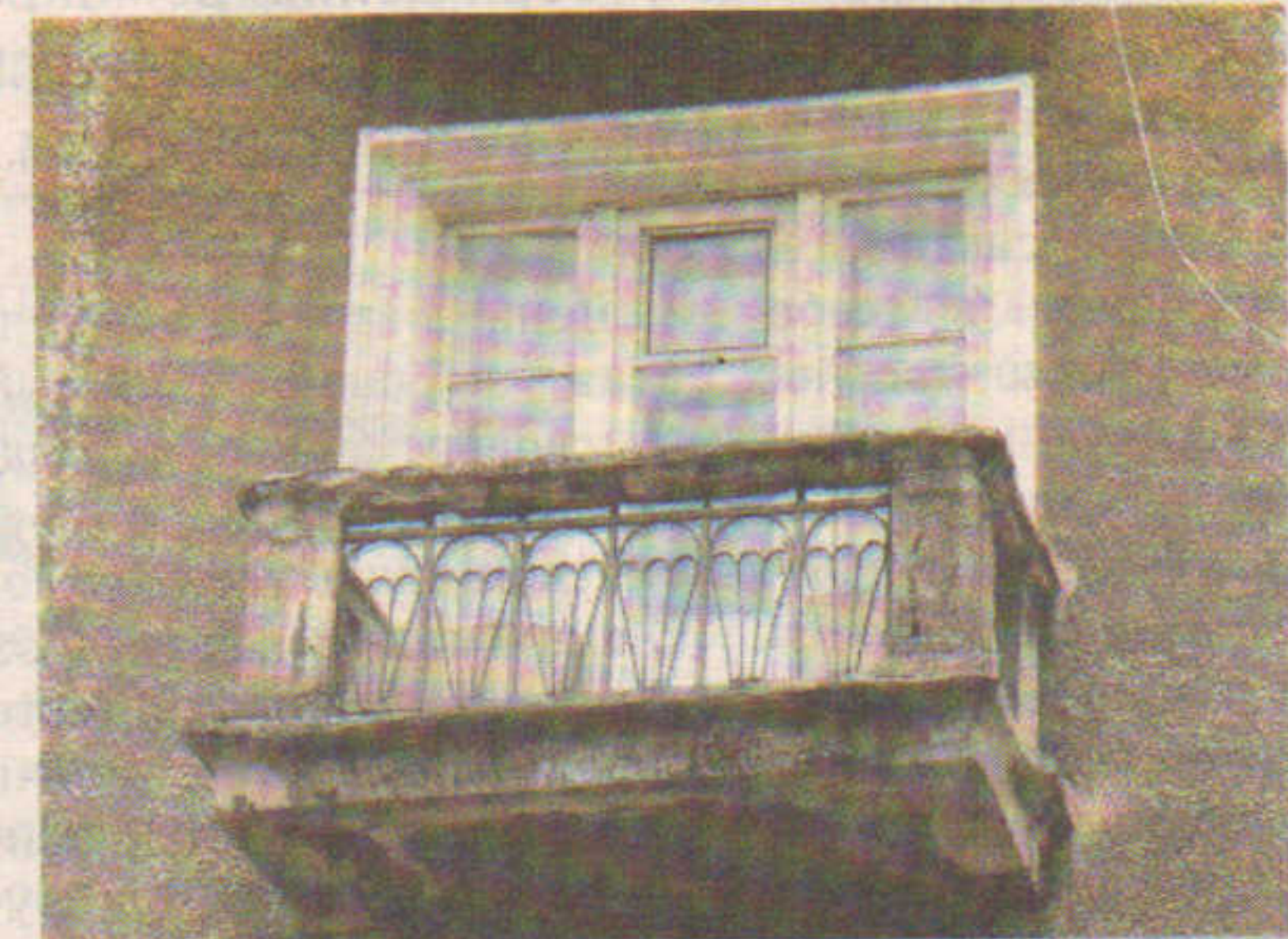
Силуэты парашютов в балконной решетке