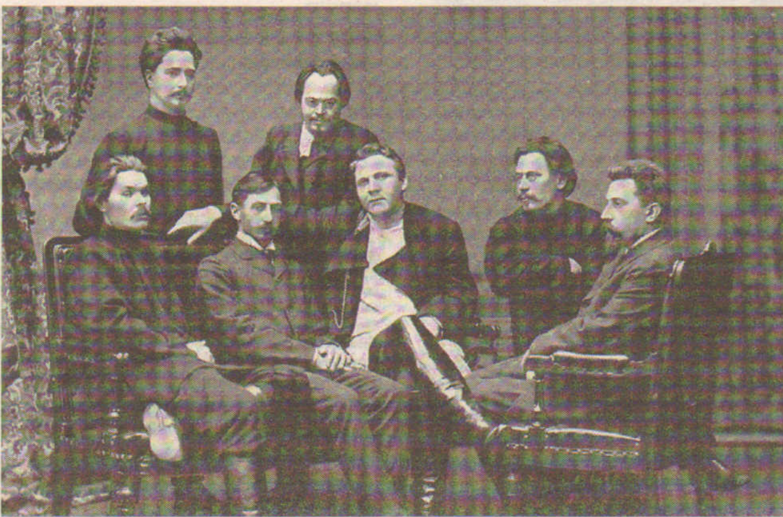
Горький и Бунин (нижний ряд слева) среди участников литературного кружка «Среда»