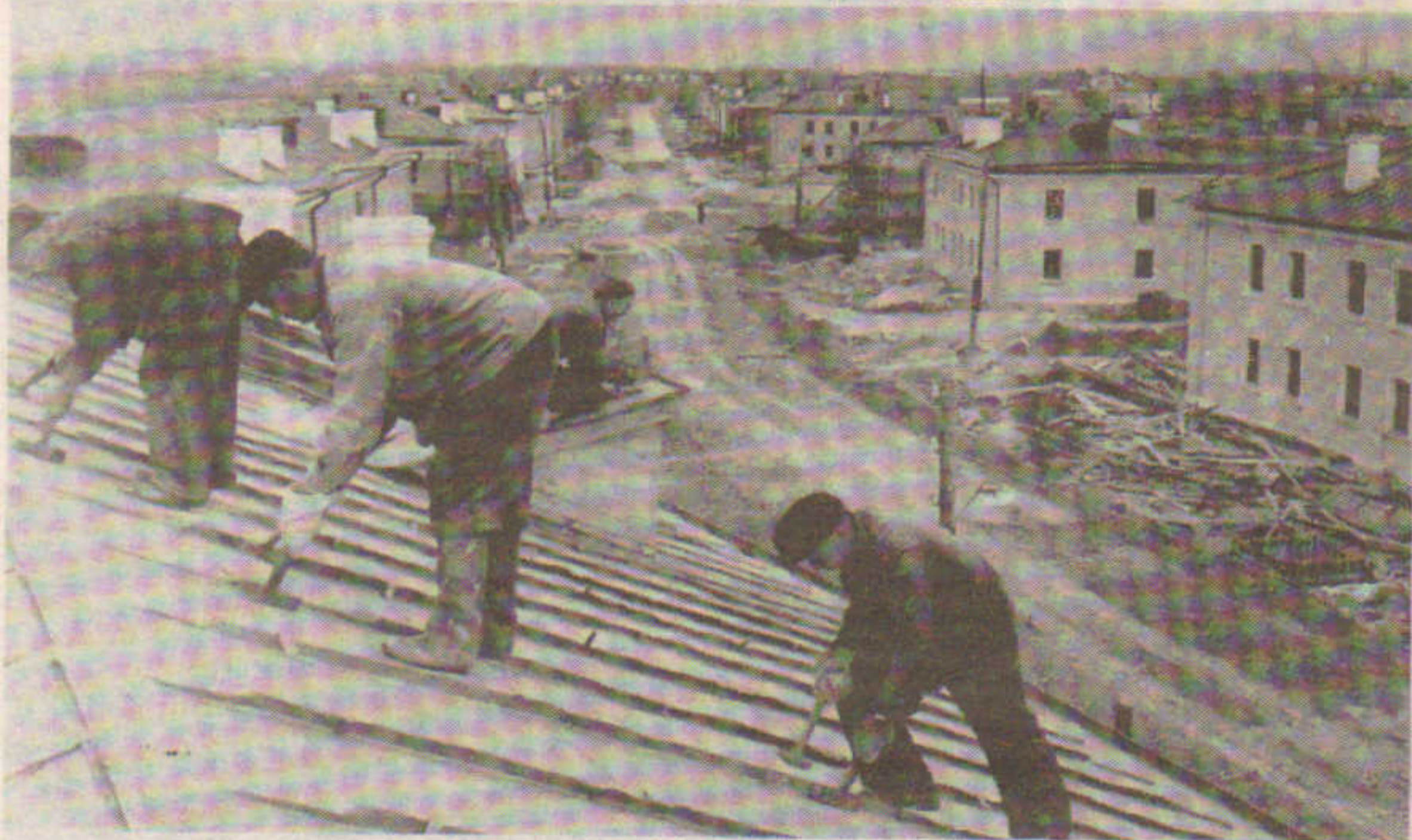
Народная стройка на улице Академика Павлова

М етод «народной стройки», или «горьковский метод», подхватила вся страна. Весной 1957 года проекты 8- и 16-квартирных домов, разработанные специалистами Горьковского горпроектга во главе с Юрием Бубновым, были разосланы в крупнейшие города СССР.