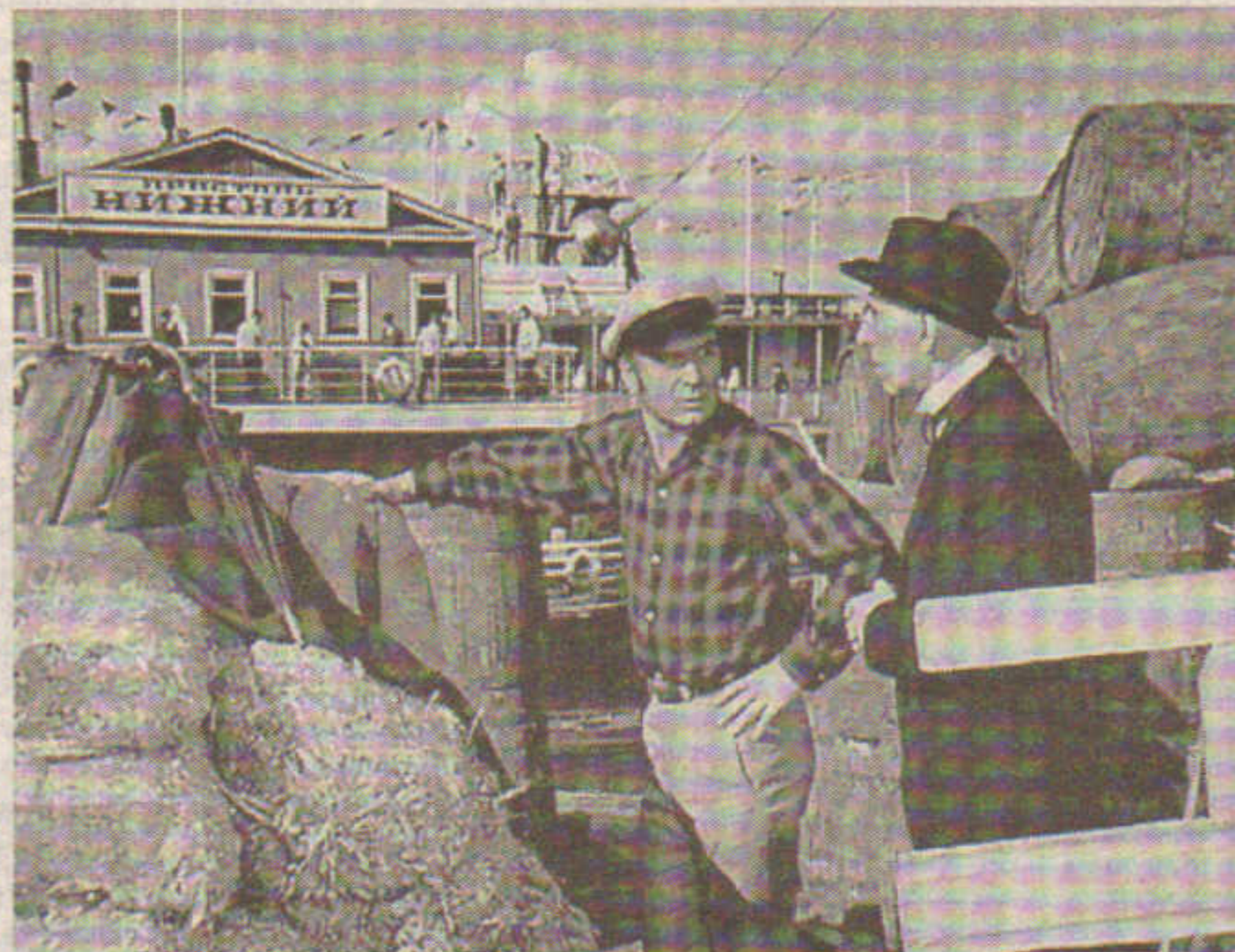
Кадр из кинофильма «12 стульев»