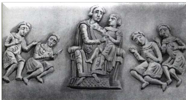
Всеволод с сыновьями

“Ноября 27 родился великому князю сын и нарече его во имя дедне Георгий”, отметил летописец под 1189 годом. Это первая запись о времени земной жизни Юрия Всеволодовича или Георгия. Эти два написания имени основателя Нижнего Новгорода будут встречаться и позднее. (стр.7)