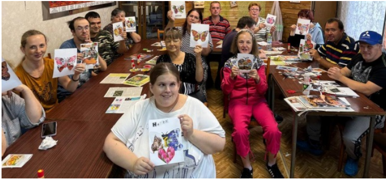
Мастер-класс по созданию коллажа из журналов и газет и работы участников