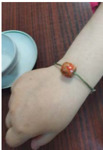
Браслет с деревянной бусиной