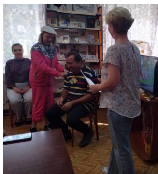
Сценка сказки «Репка»