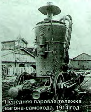
Передняя паровая тележка вагона-саморода. 1914 год