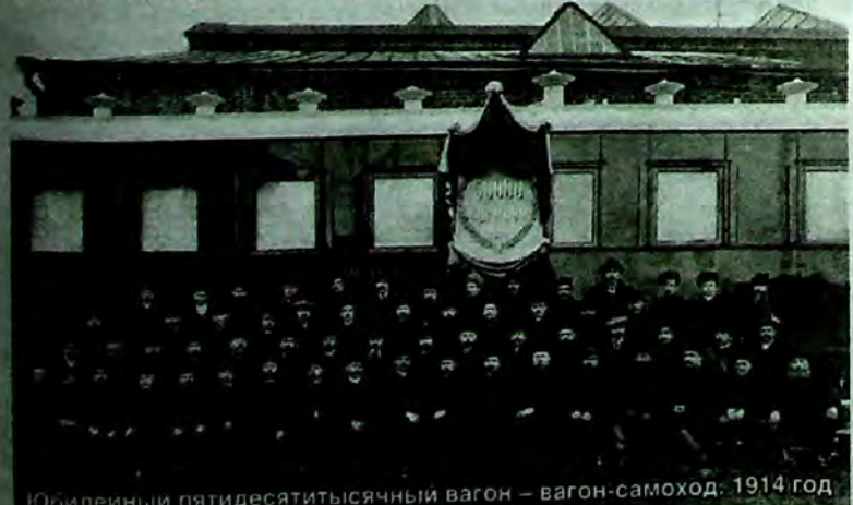
Юбилейный пятидесятилетний вагон – вагон-самород. 1914 год