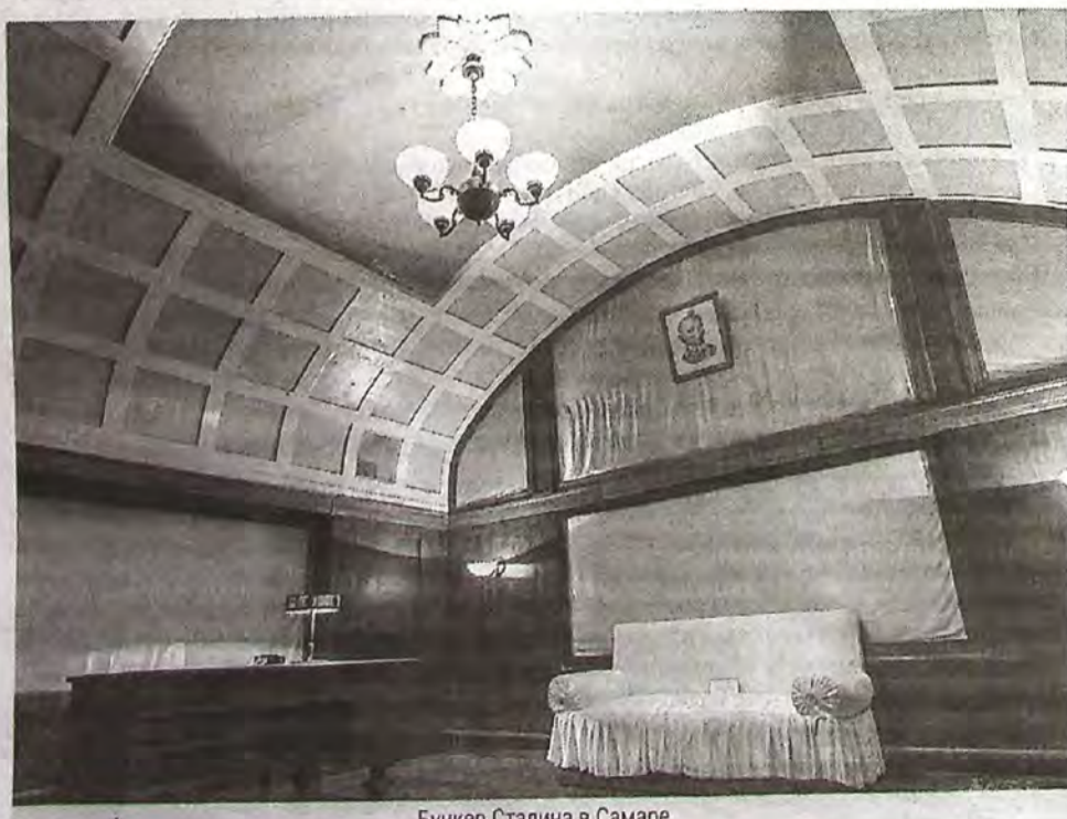
Бункер Сталина в Самаре