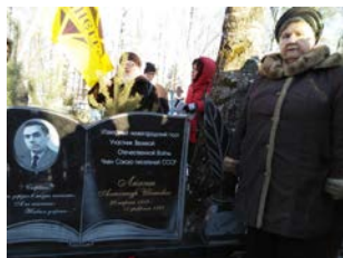
Памятник поэту А.И. Люкину