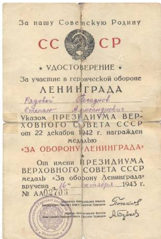
Медаль «За оборону Ленинграда» (Указ от 22.12.1942г.)