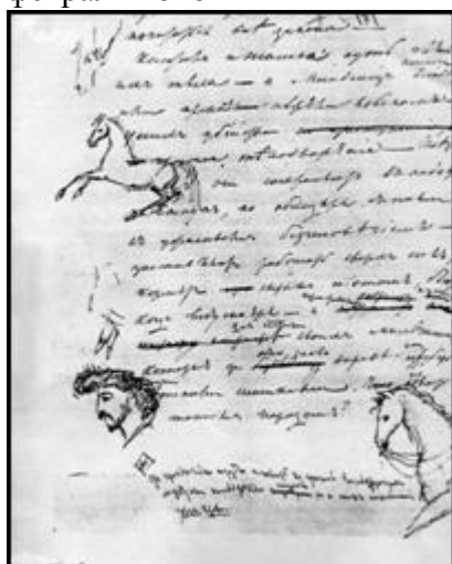
Лошадиные головы, лошади и черкес чернила Дневниковые записи 15-22 мая 1829