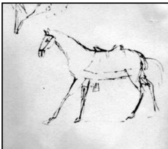
Идущая лошадь чернила «Переход через Кавказ» 18 июля 1829, Арзрум