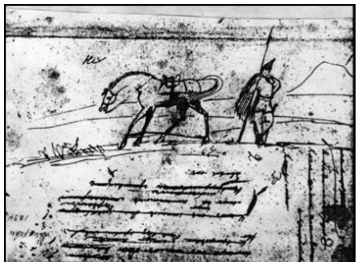
Конь и богатырь с копьем чернила «Он между нами жил» 10 августа 1834