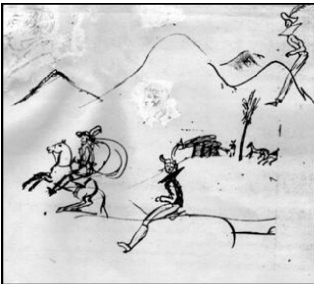
Всадники, горы чернила «Вяземскому» 1821, Каменка