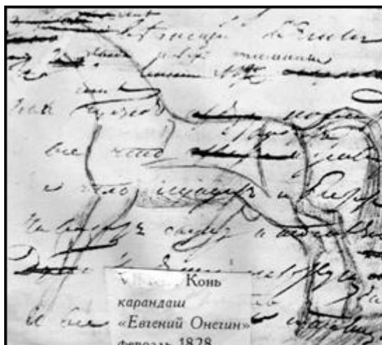
Конь карандаш Евгений Онегин февраль 1828